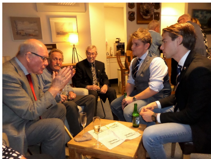
Sterke verhalen op de nieuwjaarsreceptie

Mede gelet op de omvang van het vermogen van het College heeft het bestuur een extern accountskantoor in de arm genomen ter controle van de jaarcijfers. Dit bureau heeft het financieel jaarverslag beoordeeld en goedgekeurd op grond waarvan het bestuur het heeft vastgesteld, zie hiervoor de bijlage. Door deze gewijzigde procedure zijn de werkzaamheden van de kascontrolecommissie tot een eind gekomen. Bij de eerstkomende ledenvergadering zal aan de leden van de dan opgeheven commissie decharge worden verleend. De Rekening en Verantwoording dient vastgesteld te worden door de Algemene Ledenvergadering. Gezien de bijzondere omstandigheden als gevolg van Covid-19, waardoor er geen ALV gehouden kan worden, zal die instemming dit jaar niet afgegeven kunnen worden. Goedkeuring wordt derhalve aangehouden tot de eerstvolgende ledenvergadering.