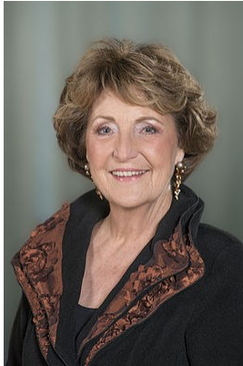
H.K.H. Prinses Margriet Beschermvrouw Zeemanshoop

Telefoon: 020-6253 515 E-mail: info@zeemanshoop.nl