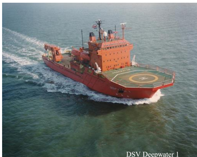
DSV Deepwater 1

In 1982 was ik gaan werken op de Diving Support Vessels Deepwater 1 en Deepwater 2 . Deze zeer geavanceerde schepen waren eigendom van offshore constructiebedrijf Brown & Root en de duikfirma Wharton Williams. Beide schepen waren ongeveer 100 meter lang, gebouwd op de werf van de Hoop in Lobith en kostten in 1982 al meer dan 100 miljoen gulden. Ze waren speciaal gebouwd om duikers in staat te stellen om op zeer grote dieptes te werken dankzij het "saturation diving system". In het schip waren drie grote druktanks gebouwd waarin de duikers voor langere tijd konden verblijven. Op deze druktanks kon een duikerklok worden aangesloten en midden in het schip was een gat gemaakt (moonpool) waardoor de klok naar beneden ge-