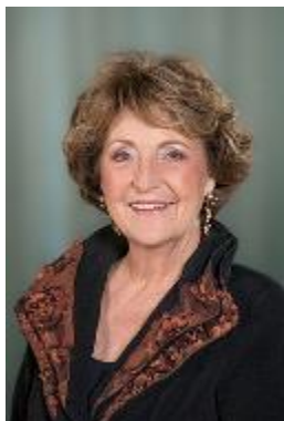
H.K.H. prinses Margriet Beschermvrouwe

Opgericht 1 mei 1822 Muntplein 10a 1012 WE Amsterdam 020-6253515 info@zeemanshoop.nl