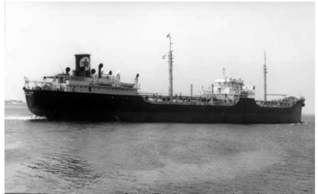
Caltex The Hague voor de verbouwing

U kunt uw bijdrage ook sturen naar: info@gbooksinternational.nl of Jandirkdavidse@gmail.com