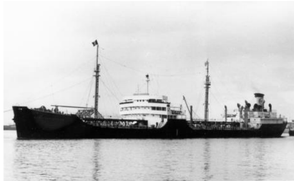
s.s. Esso Amsterdam