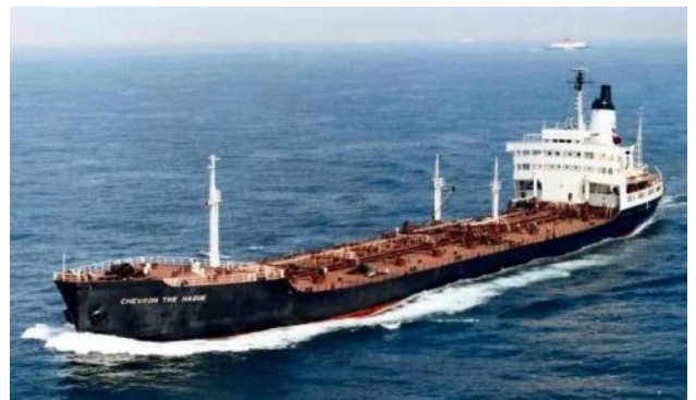
Chevron The Hague na de verbouwing