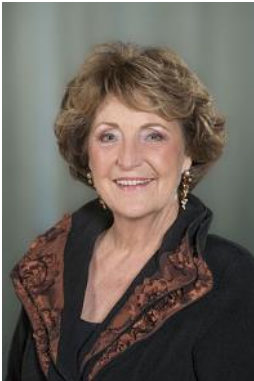
H.K.H. Prinses Margriet Beschermvrouwe Zeemanshoop