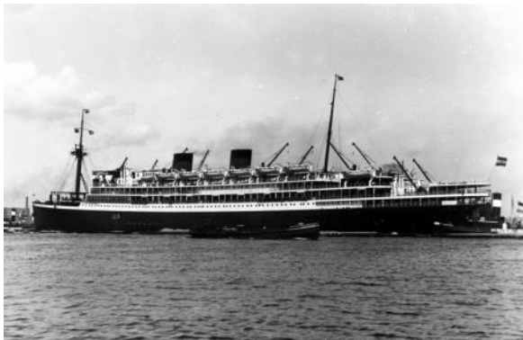
s.s. Johan van Oldenbarnevelt

Intussen was het donker geworden, de wind was nog meer aangewakkerd en de „Esso Amsterdam" slingerde zwaar. Er werd getracht het schip met langzaam draaiende machine in een dusdanige positie te brengen, dat het slingeren zou verminderen. Door de hoge zee werd de motorsloep vier maal uit de takels geslagen; voor de vijfde maal werden de takels aangebracht en nu gelukte het: de sloep werd uit het water gelicht. Plotseling echter sloeg een hoge zee de achterste takel van de sloep weg, waardoor deze nu verticaal in het water aan de voorste takel kwam te hangen. De vijf inzittenden, die allen zwemvesten droegen, geraakten te water; enkele reddingsboeien werden hen toegeworpen en al spoedig gelukte het, zij het met veel moeite, hen aan boord te halen.